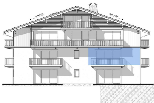
Façade Sud / South Front